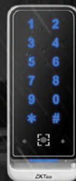
QR600 - VK