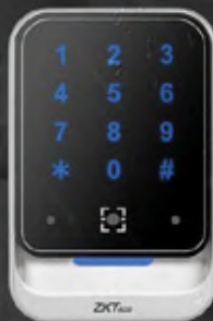
QR600 - HK