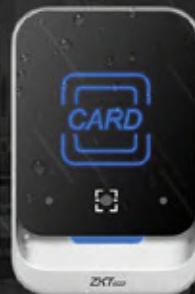
QR600 - H