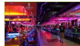
Lugares de entretenimiento